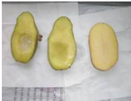
Osservazioni dopo 40 minuti

Al tatto la patata con il sale appare più molliccia (16 persone)