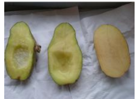
Osservazioni dopo 2 ore

Nella patata che aveva il pozzetto con acqua, quest'ultima è stata assorbita perché il livello si è abbassato ed è più turgida al tatto