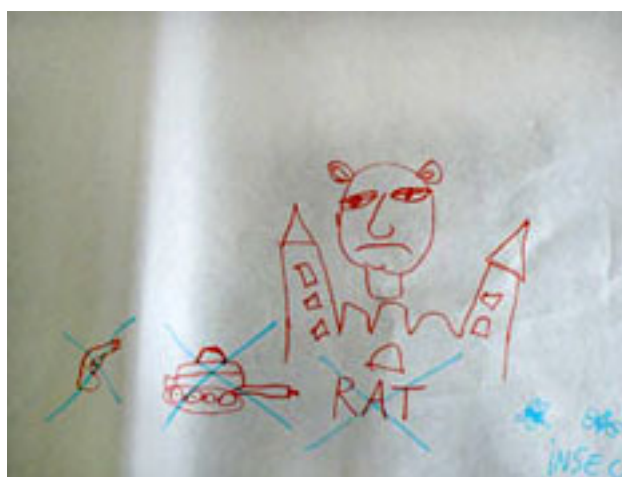
Il mio disegno del castello nel foglio delle cose di cui liberarsi

Due giorni dopo che il ragazzo ci ha presentato il castello della strega, ho avuto l'occasione di mettere a fuoco almeno uno dei significati che ho visto emergere dall'immagine nel suo collage, ed è stato quando ho chiesto al gruppo di rappresentare in un grande foglio ciò che amavano ed era importante per loro, e in un altro foglio le cose di cui si sarebbero volentieri liberati e che volevano buttare via. Ho disegnato anch'io con loro nei due fogli, e quando ho riprodotto il castello e il personaggio del collage nel foglio delle cose da buttare via, ho detto al gruppo che il personaggio/strega mi faceva pensare ai politici che fomentano l'odio e la guerra e perciò avrei voluto sbarazzarmene. Il ragazzo autore del collage mi ha guardato con espressione di meraviglia e sembrava contento, tanto che mi ha chiesto di andare insieme a visitare le rovine del castello, cosa che abbiamo fatto subito dopo la fine del lavoro di gruppo.