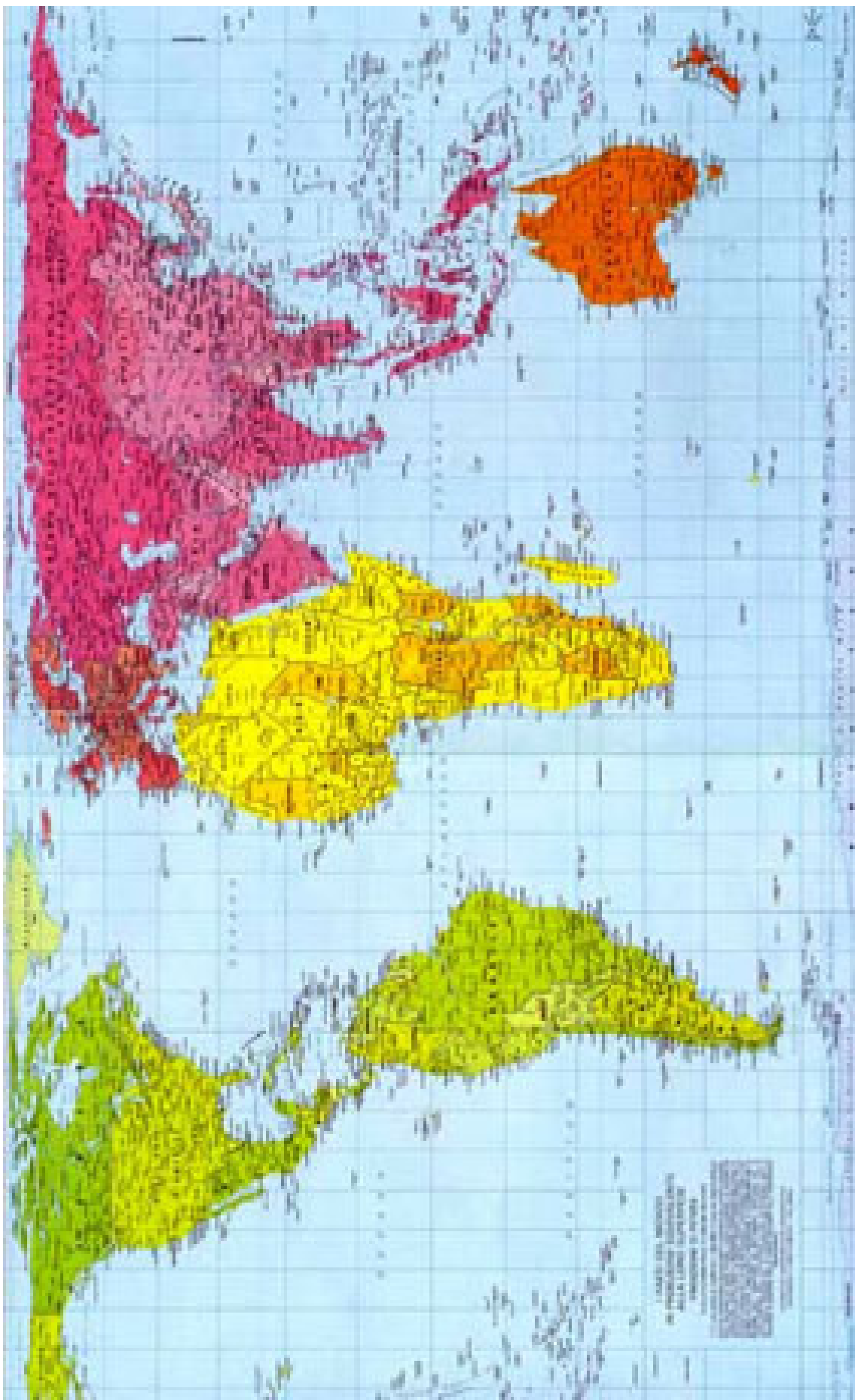
Immagine n. 1